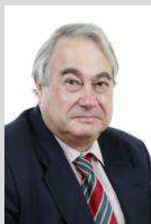
Rapporteur Jean-Noël Cardoux Sénateur (Les Républicains) Loiret (Centre-Val de Loire)