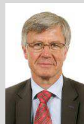
Rapporteur Yves Daudigny Sénateur (Socialiste et Républicain) Aisne (Hauts-de-France)