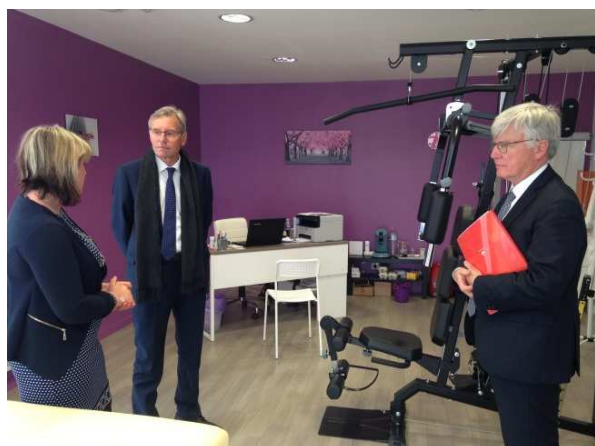
Maison de santé de Rozoy-sur-Serre (02)