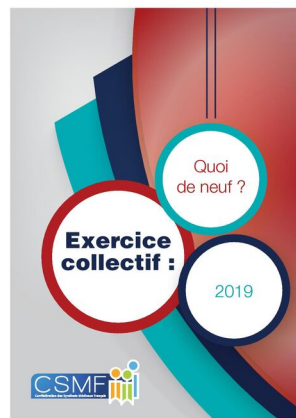
Emploi dans les cabinets médicaux