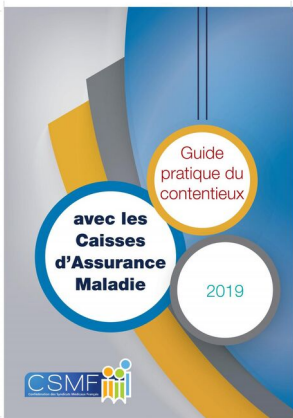
Contentieux avec les caisses

Pour faciliter le quotidien de ses adhérents, la CSMF met à leur disposition des guides pratiques.